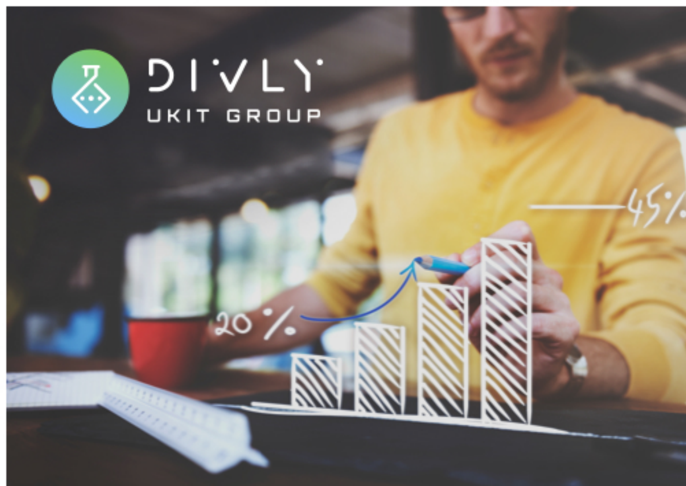
Разположение горизонтального лого на темном фоне